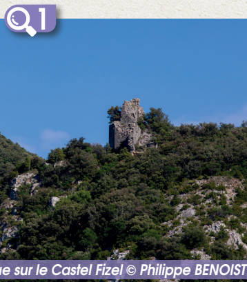
Vue sur le Castel Fizel