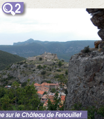
Vue sur le Château de Fenouillet

Cependant, Fenouillet, désormais placé sur la nouvelle ligne de frontière, conserva son rôle stratégique et on ajouta au système défensif du Q2 château de Fenouillet Q3 la Tour Sabarda et Q1 Castel Fizel pour surveiller les quatre points cardinaux et ainsi faire face à toute attaque. Les récentes recherches archéologiques et les travaux de restauration mirent en évidence la présence d'un monastère consacré à Saint Pierre (des panneaux thématiques au Château de Fenouillet vous ouvriront les mystères de ce site...)