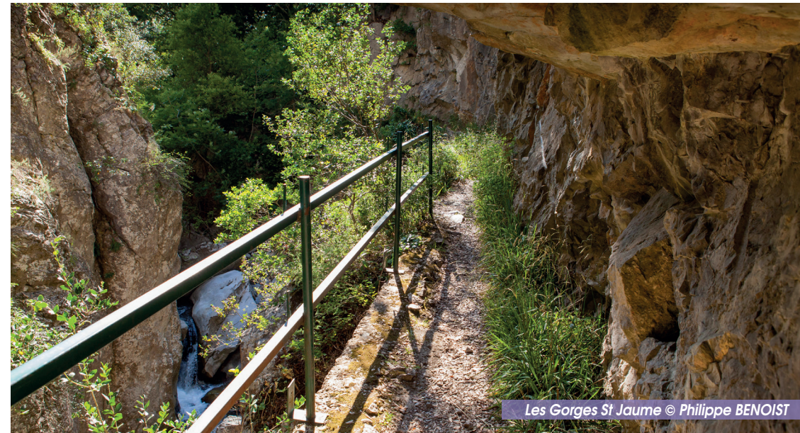
Les Gorges St Jaume