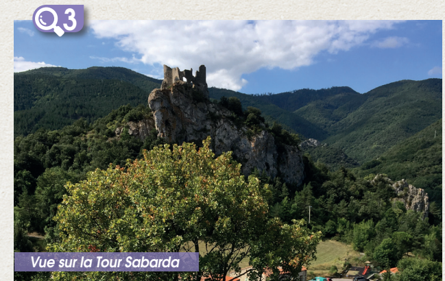
Vue sur la Tour Sabarda